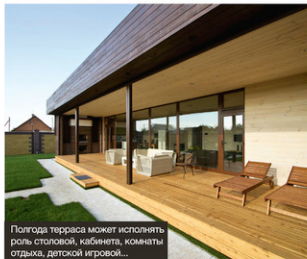
Полгода терраса может исполнять роль столовой, кабинета, комнаты отдыха, детской игровой...