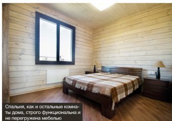
Спальня, как и остальные комнаты дома, строго функциональна и не перегружена мебелью

естественное, природное настроение. Входная дверь обращена к калитке. Сразу за дверью – небольшая тамбур, рядом с которым «спряталась» кофейное помещение и санузел. За тамбуром следует главная комната, где нашлось место зонам приготовления пищи, столовой и гостиной. Рядом с общественным – личное пространство: две спальни, хозяйский санузел, кабинет.